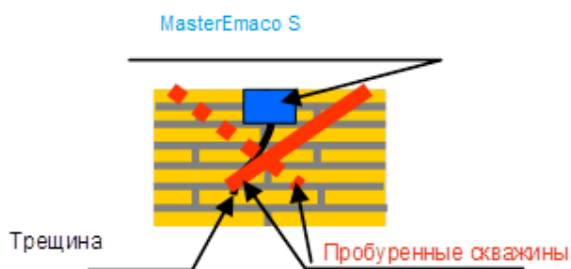
Рисунок 1 Примерная технология инъекции трещин.